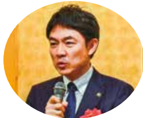
椎根健雄 郡山市長