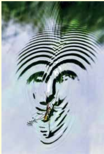
写真／市長賞 熊田 孝一『愛の気持』