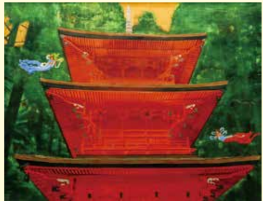
日本画／市長賞 木目沢 義一『女神の塔』